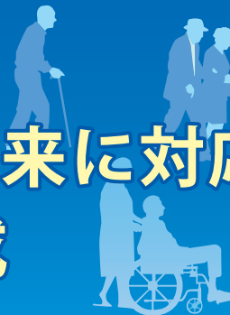
65歳以上人口比率の長期推移・将来推計